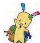
▲ 狭山市七夕の妖精 おりびい