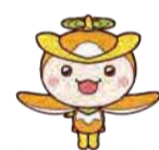
▲ 所沢市イメージマスコット トコロん