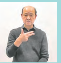
手の甲を相手に向け、親指・人差し指・中指を立てる(指文字の「し」)