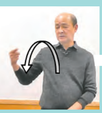
人差し指を立て、体の前から外に向け山を描く