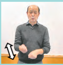
両手でクワを持ち、2回地面を耕すイメージ