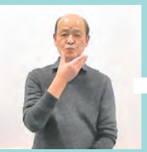
顎ひげを2回つまむイメージ