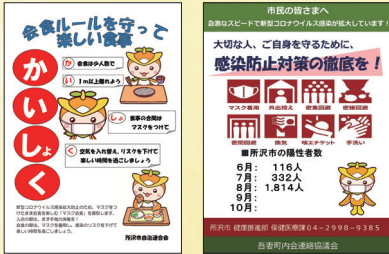
▲吾妻町内会連絡協議会が作成したポスター

また、市内の感染状況が分かるポスターを作成し、町内会・自治会の掲示板で周知。情報が入手しづらい人のために、情報発信に努めています。