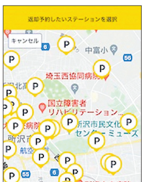
①アプリで返却できるステーションを予約