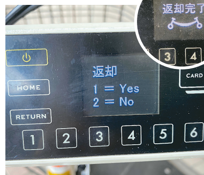
③操作パネルで「1」を選択。「返却完了」が表示されて完了