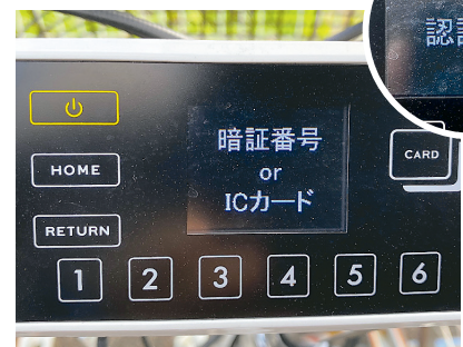
④操作パネルの電源を入れ、暗証番号を入力。「認証OK」の表示後、鍵が開く