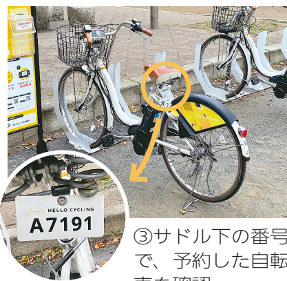
③サドル下の番号で、予約した自転車を確認