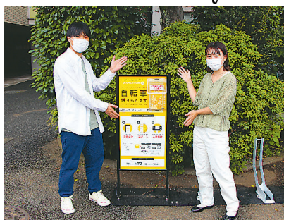
②予約したステーションへ