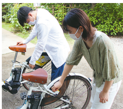
②返却予約したステーションで自転車を止め、鍵を掛ける