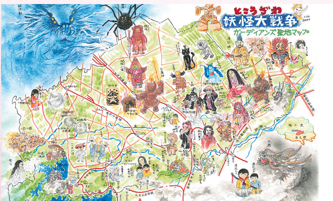
初出:「武蔵野樹林」vol.7 地図作成:村松 昭

内の妖怪聖地MAPも要注目! (市役所3階経営企画課でも配布中) さらに2019年に市内の小中学生たちが応募した「角川むさしの妖怪絵コンクール」の受賞作品の一部が、なんと映画に出演!? ぜひ劇場で探してみてくださいね。 ☎同課 ☎2998-9027