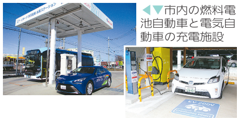
◀市内の燃料電池自動車と電気自動車の充電施設

購入時には、減税や国の補助金を受けられることも。中でも、燃料電池自動車と電気自動車は、市のスマートハウス化推進補助金（家庭用）の対象です（本紙5月号12面参照）。