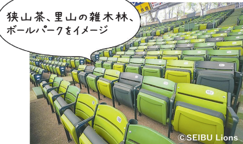
狭山茶、里山の雑木林、ボールパークをイメージ

ボールパーク化されました。 自然と共生する開放感に満ちあふれたドームで、老若男女あらゆる世代の皆さんがより楽しめる施設になるよう改修。試合観戦はもちろん、試合以外でも球場外でもワクワクが盛りだくさん♪チームをさらに強くするための練習設備も整えました。