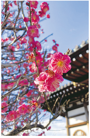
◀梅の花 祖父母のお墓参りに訪れた瑞岩寺の梅の花。この写真を見た親戚が、うちの家紋も梅の花だと教えてくれました ●香香（西所沢）