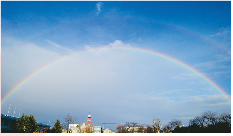
▲ダブルレインボー 雨上がりの所沢の空にかかった大きな二重の虹に感動！ ●OKIRAKU（宮本町）