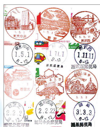
▲数字並びの消印 令和の初日のほか、5回あった令和の数字並びの日の郵便消印を集めました ●もりさん（上新井）