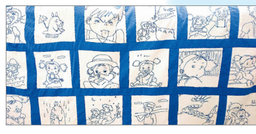
▶ソファカバー 我が家の窓から、トトロゆかりの森が見えます。大好きな場面を刺しゅうして楽しんでいます ●ひじきママ（松が丘）