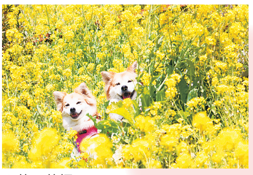
▲菜の花畑 菜の花に囲まれて春の香りを楽しむふたり。人も犬も春が待ち遠しい ●保護犬を家族に（山口）