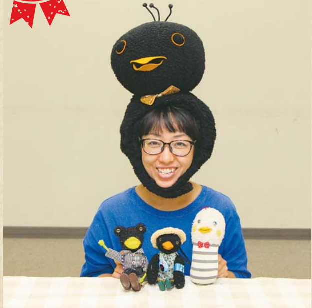
ぬいぐるみ作家・ひばりちゃんの生みの親