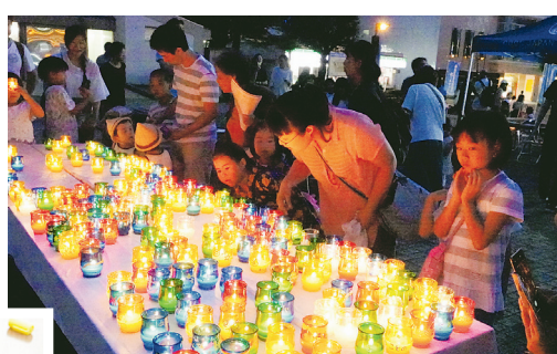
思い思いの絵を キャンドルに♪