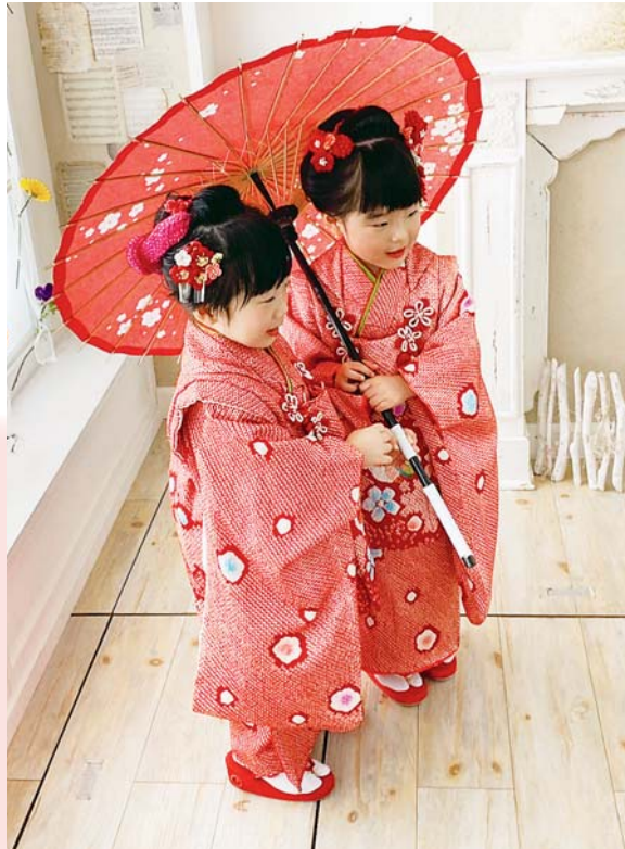
▲双子の前撮り 双子で小さく産まれた孫たちもう3歳。 この秋の七五三が楽しみです ●マーマレードママ（小手指町）