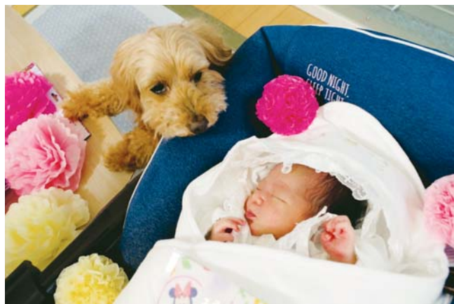
▲これから仲良くしてね♥ 里帰り中のひとコマ。実家のわんこが 見守ってくれました ●たぬきち（泉町）