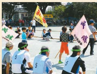
▲自治会の誇り!旗で応援