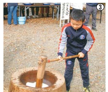
① 5月 みんなで協力して一列ずつ苗を植えます ② 9月 たわわに実った稲穂を収穫！ ③ 11月 育てたお米の一部（もち米）を使って収穫祭で餅つき