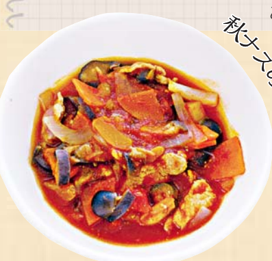
秋のナスのイミダマ

材料 2人分 ナス…小1個 牛もも肉薄切り（しゃぶしゃぶ用）…100g 赤ワイン…小さじ1 玉ネギ…1/4個 エリンギ…小2本 トマト…小1/4個 小麦粉…大さじ1/2 オリーブ油…小さじ1/2 水…100ml コンソメ…小さじ1/2 ケチャップ…大さじ2 中濃ソース…大さじ1/2 みそ…小さじ1 コショウ…少々 ごはん…お好みで