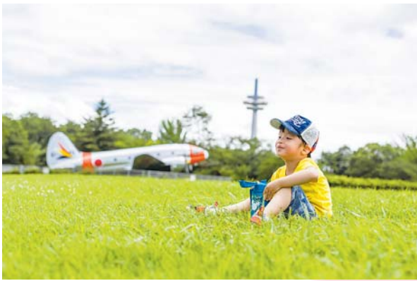
▲ちょっと一服 息子と父、男2人の休日。 ここらでちょっと水分補給 ●ほしうめ（東町）