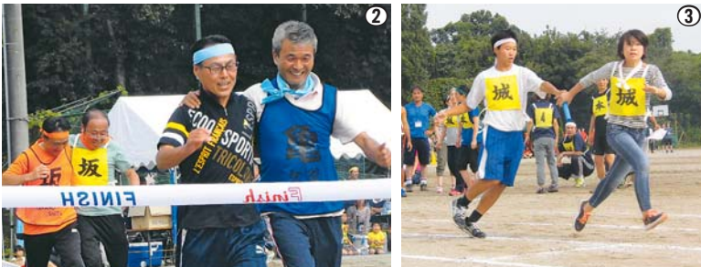
①生徒と地域の方々力が合わせる綱引き ②子どもたちに負けてられない！と二人三脚にも熱が入ります ③地区対抗リレーは、生徒も大人も全速力で駆け抜けます！