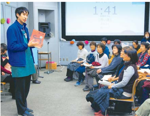
▲ 1人5分で本の魅力を伝えるビブリオバトル。読みたかった、知らなかった"あなたの1冊"に出会えるチャンス！

ビブリオバトル とは、「本の面白さを多くの人に伝えたい！」という熱意を持った発表者（バトル）たちが、それぞれイチオシ本を紹介し、その中から観覧者が一番読みたいと思った本を投票で決めるゲームです。