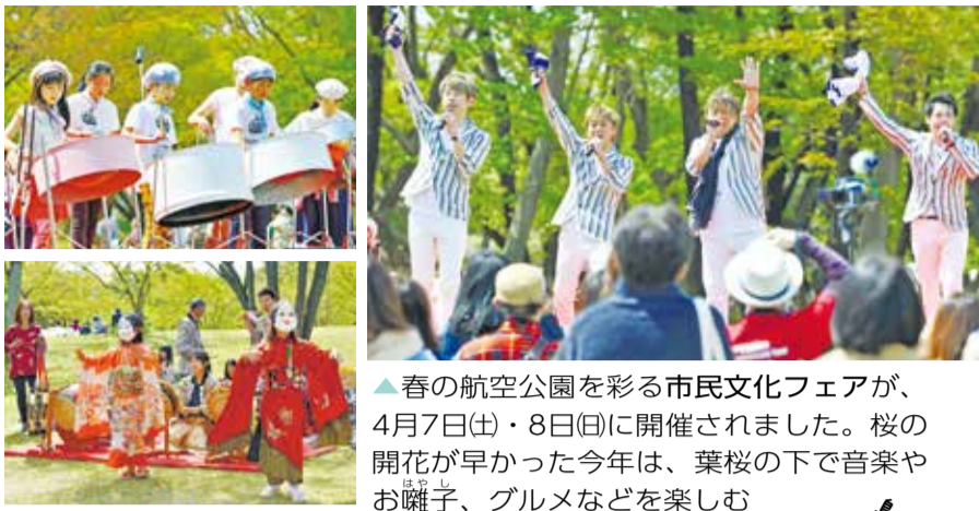
▲春の航空公園を彩る市民文化フェアが、4月7日(土)・8日(日)に開催されました。桜の開花が早かった今年は、葉桜の下で音楽やお囃子、グルメなどを楽しむ多くの市民の姿が見られました。