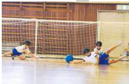
市内の小学校で開催したゴールボール体験会。子どもたちは初体験でしたが、ボールの中の鈴の音を頼りに腕を伸ばします

▶市民体育館で練習中のゴールボール日本代表の選手たち。日々チームワークに磨きをかけます