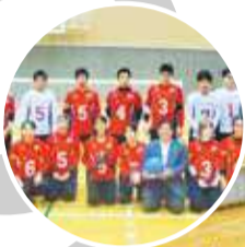
メダル目指して頑張っています！

▶市民体育館で練習中のゴールボール日本代表の選手たち。日々チームワークに磨きをかけます