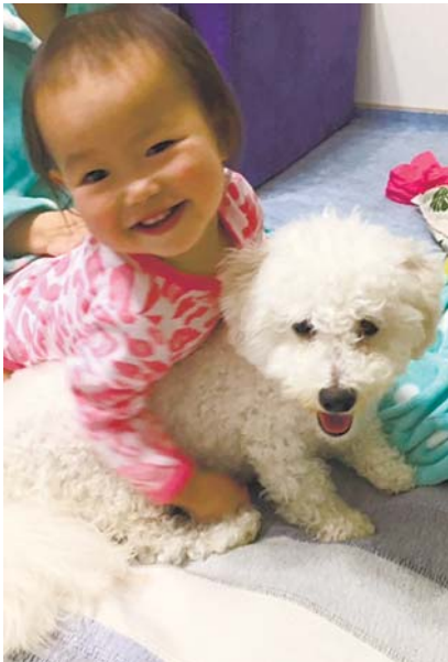
◀ 仲良し仲良し！ 同い年の1歳。とっても仲良しなんです♪ ● はあぶ (狭山ヶ丘)