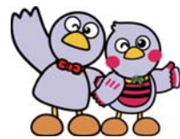
コバトン&さいたまっち

現在、30団体が活動しています。参加団体には、活動に必要な物品の支給や用具の貸出などを行います。活動中の事故は市民活動総合補償制度（8面参照）が適用されます。 問市民活動支援センター ☎ 29968・8391 インターネットを使って県政の課題のアンケートに答える県政サポーターを募集します。 対満16歳以上でホームページ閲覧やメールの利用ができ、日本語が使える方を募集します。 問詳細は、県HP（県政サポーター）をご覧ください。 問県・広聴広報課 ☎ 048・8330・2850