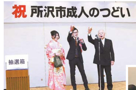
▲市内 11 会場で行われた 1 月 9 日(祝)の成人のつどい。新成人の皆さんが旧交を温め、キラキラした笑顔を見せていました。