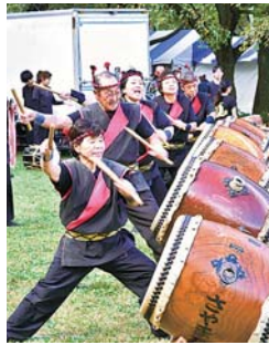
▲例年、和太鼓やダンスなどの企画を開催しています。

10月28日(土)・29日(日)開催 市民フェスティバル企画を募集 次の全てを満たす方 ▼市内在住・在勤・在学の個人・市内企業・団体▼5月11日(休)の面接に参加可能▼当日に企画運営可能 申開★4月7日(金)までに申込書を市役所5階地域づくり推進課(市 ☎2998・9083)に直接 ◎申込書は同委員会(市HPで、市民フェス)、同課で入手できます。事前相談も受け付けています。