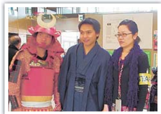
▲一緒にフォーラムを盛り上げましょう!

ボランティア参加者の感想 普段、外国の方と関わることがないので、とてもいい体験でした! 互いの文化やコミュニケーションを楽しめるイベントでした。