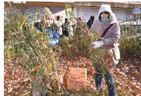
◀ 柳瀬川を挟んで所沢市と東村山市にまたがる淵の森で、1 月 15 日(日)、下草刈りが行われました。中心団体の会長を務める宮崎駿監督も参加し、一緒に汗を流しました。