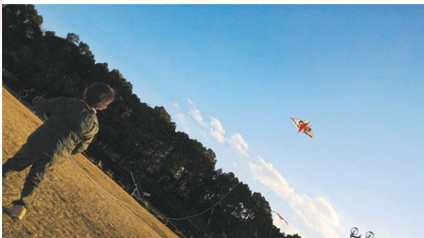
▲ たこ揚げ成功！ たこ揚げ初体験。小さい体で遠くのたこを操ってます。 ● みお丸 (山口)