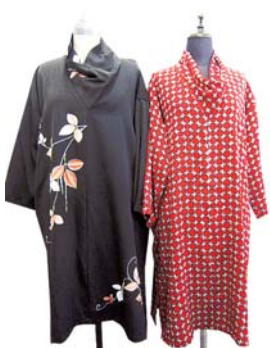
▲着物はエコロが用意。誰でも作れます!

② 着物で作る合わせ襟風チユニック 日場 2月16日(日)午前9時30分〜午後3時 定員 10人(抽選) 費用 500円(材料費) 持裁縫道具、ものさし、昼食