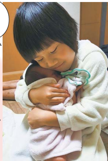
▶ できあ 溺愛 6歳離れた妹に毎日ハグしてくれるお姉ちゃん。これからいろいろお世話をよろしくね♥ ● モスグリーン (小手指元町)