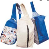
▲大好評企画につきアンコール!

日場 3月5日(日)午前9時30分〜午後3時 定員 10人(抽選) 費用 400円(材料費) 持 ジーンズ1本、裁縫道具、ものさし、昼食 申込 2月4日(土) (消印有効) / までに往復はがき往信面に講座名・住所・氏名・電話番号を記入し、〒359・0015 日比田620・1リサイクルふれあい館 ☎ 2994・5374 に郵送 / ★ 同館に電話