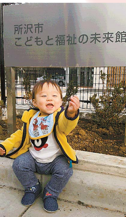
▲ 待ち遠しいな〜♪ 最近歩き始めました。こどもと福祉の未来館はお散歩＆ひなたぼっこにちょうどいい距離で、オープンを楽しみにしています。 ● みゃあ (泉町)