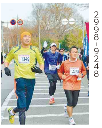
第24回大会の様子

費▼小学生以上アマチュアの方 ハーフ：4,500円▼5km：3,500円▼小・中学生：500円▼オープン：1,800円▼ファミリー：2,300円 申 郵便振替：9月1日(月)から5日(金)までに、市役所6階スポーツ振興課、生涯学習推進センター、まちづくりセンター、体育施設、所沢駅・狭山ヶ丘・小手指サービスコーナーに備え付けの申込書(払込取扱票)で、参加費をゆうちょ