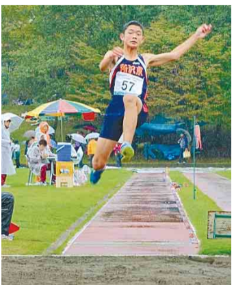
第14回大会の様子

費▼小学生：500円▼中学生：600円▼高校生：800円▼一般：1,000円▼リレー1チーム：1,000円(小学生)、1,500円(中学生・高校生) 一般 申 大会要項をご覧くださいの上、9月22日(月)