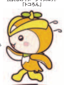
所沢市のイメージマスコット「トコロん」