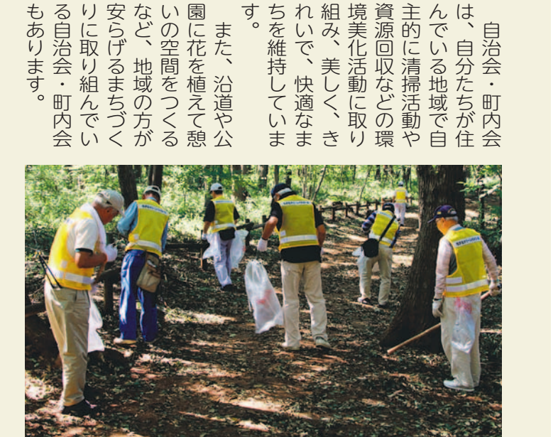
▲環境クリーンパトロール(所沢松が丘自治会) ▲花の会(東住吉町内会)