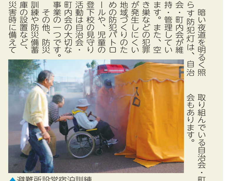
▲避難所設営宿泊訓練(東所沢和田一丁目・二丁目・三丁目自治会) ▲交通安全教室(三ヶ島地区区長会)