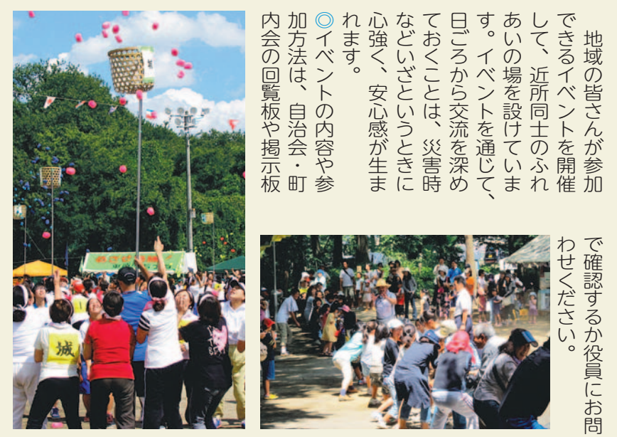
▲柳瀬地区・柳瀬中学校合同体育祭(柳瀬地区区長会) ▲やすまつ祭り=綱引き大会(安松町内会)

地域の皆さんが参加できるイベントを開催して、近所同士のふれあいの場を設けています。イベントを通じて、日ごろから交流を深めておくことは、災害時などいざというときに心強く、安心感が生まれます。 ●イベントの内容や参加方法は、自治会・町内会の回覧板や掲示板で確認するか役員にお問い合わせください。