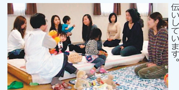
▲子育てママのティーサロン(新所沢団地自治会)

誰もがいつまでも健康で、いきいきと暮らせるよう、地域の方のふれあいの場を設け、近所同士で助け合いや支え合える取り組みを行っています。 高齢者の多い地域では、高齢者向けのサークル活動や、高齢者が孤立しないよう、お互いの悩みや困りごとを自由に話し合える居場所を提供することで、ストレスや寂しさを解消するような事業も実施しています。 また、子育て世代の多い地域では、子育て支援サロンや、子育てお子さんをお持ちの方 が、子育てに関する情報交換を行う場などを自治会・町内会が設けています。こうした活動を通して、地域の皆さんが、いきいきと暮らせるよう、自治会・町内会はお手伝いしています。