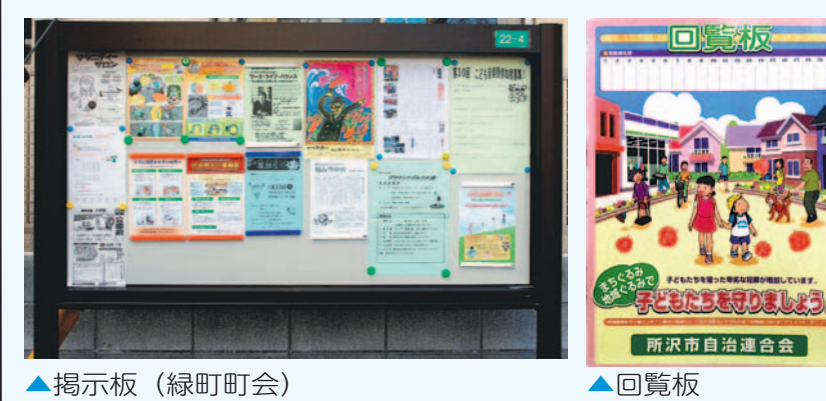
▲掲示板(緑町町会) ▲回覧板