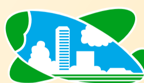
▲シンボルマーク（平成12年作成）

●市制施行30周年（昭和55年） 人口 236,476人 第1回の「所沢市民フェスティバル」が所沢航空記念公園で行われました。