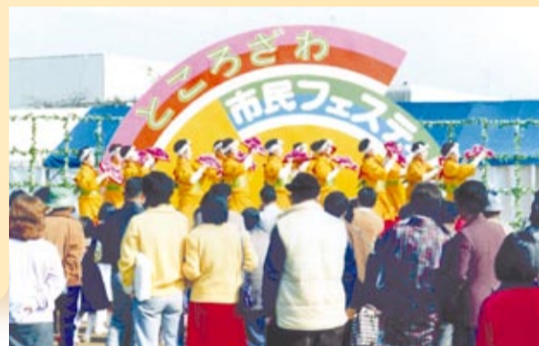
▲第1回所沢市民フェスティバル（昭和55年）

●市制施行40周年（平成2年） 人口 303,040人 この年に初めて「所沢シティマラソン」が記念事業として行われました。