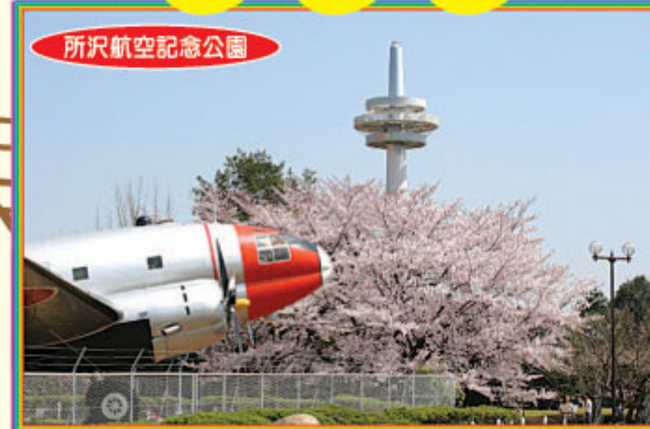
所沢航空記念公園