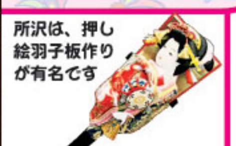
所沢は、押し絵羽子板作りが有名です

明治32年に住民総出で作られた人工の富士山で、平成21年2月には「彩の国景観賞2008」を受賞しました。山頂からの眺めは最高で、市内をはじめ新宿の高層ビルや本家の富士山まで一望できます。