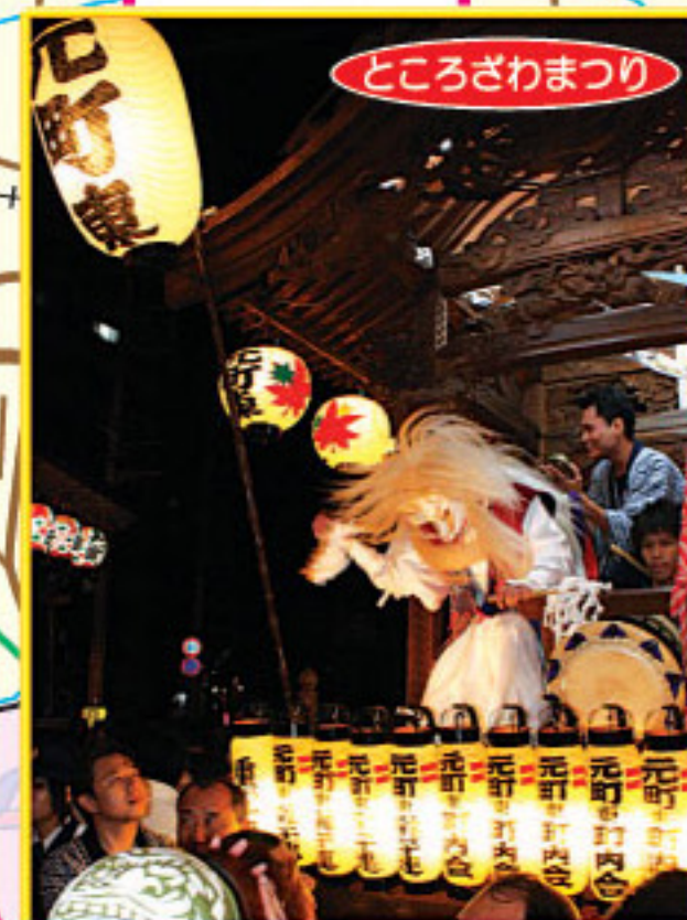
ところざわまつり

山車の曳きまわし・神輿・パレード等所沢で一番迫力のあるお祭りです。毎年10月に開催され30万人以上の人で賑わいます。