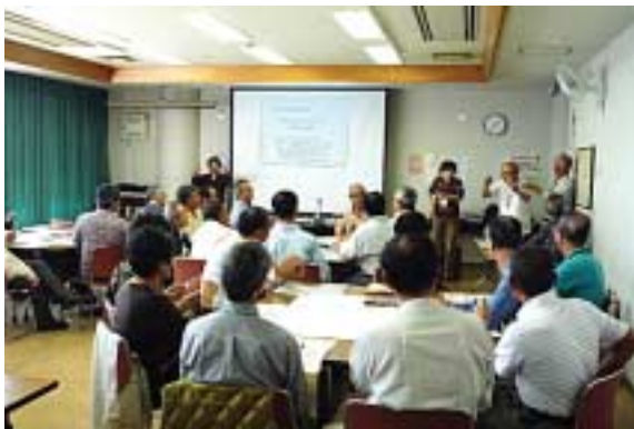
▲ 山口公民館での対話集会の様子