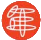
▲日本年金機構シンボルマーク

社会保険庁が廃止され、日本年金機構が公的年金の運営業務を引き継いで行います。また、社会保険事務所は、年金事務所と名称が変わりますが、年金相談などの窓口として引き続きご利用できます。手続きの必要は一切ありません。