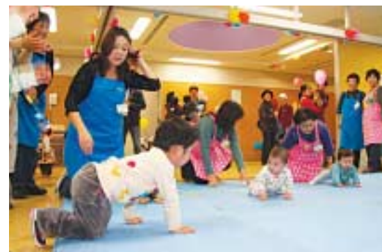
▲親子で遊ぼうコーナー(はいはい・よちよち競争)

き、または航空公園駅行きて「市民医療センター入口」下車徒歩4分 ▼航空公園駅東口②番乗り場から所沢駅東口行きて「市民医療センター入口」下車徒歩4分 問い合わせ 保健センター母子保健課 ☎2991-1811 FAX 2995-1178