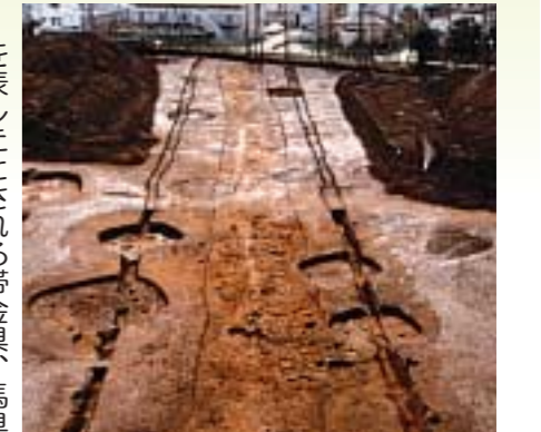
▲南陵中学校校庭で検出された幅約12m道路跡(現在は埋め戻されています)

を表したとされる帯金具、馬具などが出土していることから、役所的な集落があったと推測されています。現在遺跡は急速な宅地化の進行によってその多くが消滅していますが、幸いにも道路跡が良好に保存されているため、市の文化財(史跡)として指定しました。なお、出土した遺物は埋蔵文化財調査センター(北野2-12-1/☎29947-0012)にて展示・収蔵しています。問い合わせ 文化財保護課 ☎2998-9300