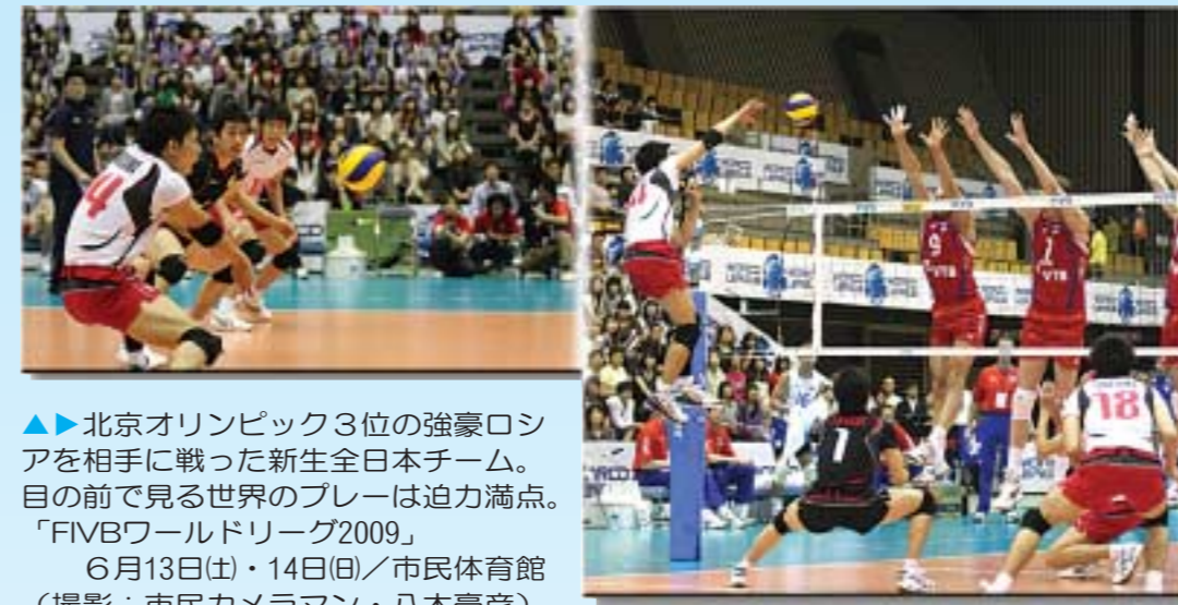
▲北京オリンピック3位の強豪ロシアを相手に戦った新生全日本チーム。目の前で見る世界のプレーは迫力満点。「FIVBワールドリーグ2009」。6月13日(土)・14日(日)／市民体育館