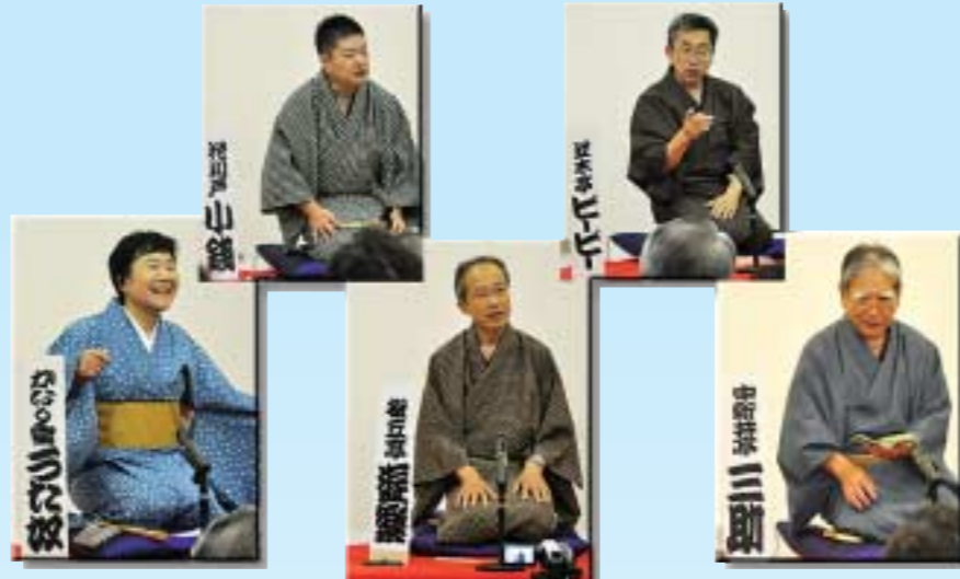
▲富岡落語研究会の皆さんによる「第1回ふらっと寄席」が行われました。日ごろの稽古の成果が、会場を包み笑いとなって実を結びます。笑いは元気の源です。5月30日(土)／男女共同参画推進センターふらっと

市内のイベントや行事などで、次の4人の方が活躍しています。 ●佐藤清一郎 ●箕輪香里 ●伊藤磨紀子 ●八木豪彦