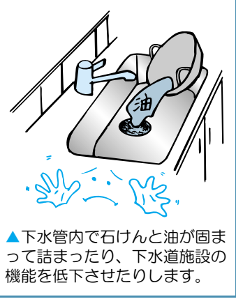
▲下水管内で石けんと油が固まって詰まったり、下水道施設の機能を低下させたりします。

問い合わせ ▶下水道の使い方…下水道維持課 ☎2998-9211・FAX2998-9408 ▶廃食用油のリサイクル…廃棄物対策課 ☎2998-9146・FAX2998-9394