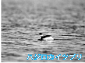
ハジロカイツブリ

カンムリカイツブリの越冬地としても有名で、この冬に飛来した群れは約100羽ほどです。長く白い首に、名のごとく冠をかぶった姿が、遠目にもよく見えます。同じ仲間ハジロカイツブリも