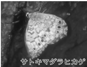
サトキマダラヒカゲ

雑木林の中、次々に飛んでくる黒いアゲハチョウ。一定のコースで飛んでいるこのチョウは、ほとんどがオスです。彼らはただ飛んでいるわけではなく、メスとの出会いを求めて、積極的に行動しているのです。