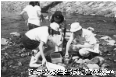
昨年の水生生物調査の様子

環境ふれあい教室は、次世代を担う子どもたちを対象に『所沢市の身近な環境に直接ふれあう』という実際の体験をとおして、市内の環境の様子やその大切さについて学んでいただく事業です。子どもたちがこの体験を通じて、日常生活の中から、環境にやさしい行動を実践していただくことを目的としています。