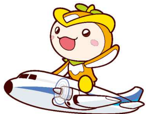
所沢市イメージマスコット