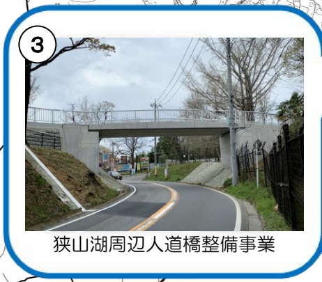
狭山湖周辺人道橋整備事業