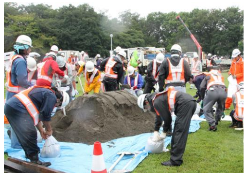
総合防災訓練の様子