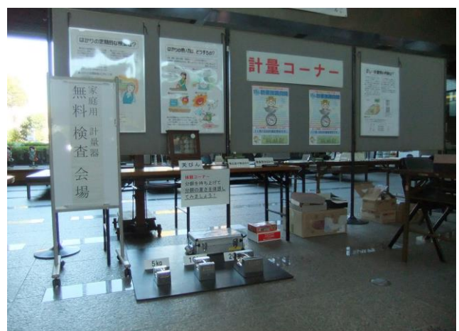
消費生活展の様子