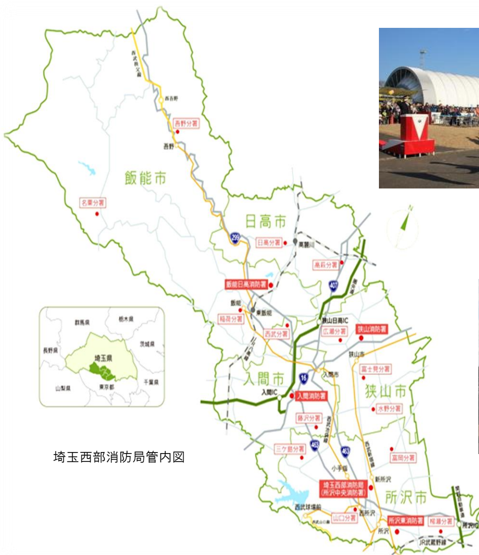
埼玉西部消防局管内図

■ 「第1次埼玉西部消防組合総合計画基本計画」に掲げる「主なとりくみ」を具現化するために実施する事務事業については、「第一次埼玉西部消防組合総合計画実施計画」に示されています。