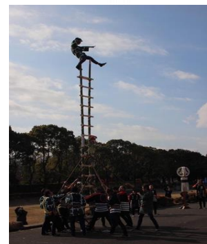
消防出初式 特別演技(はしご乗り) の様子