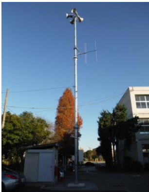
防災行政無線(中央小学校)