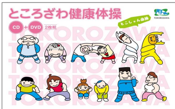
ところざわ健康体操 「とこしゃん体操」