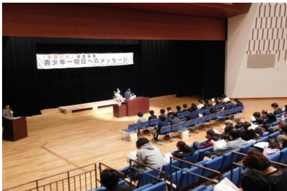
「家庭の日」推進事業 〈青少年一明日へのメッセージ〉作文表彰式