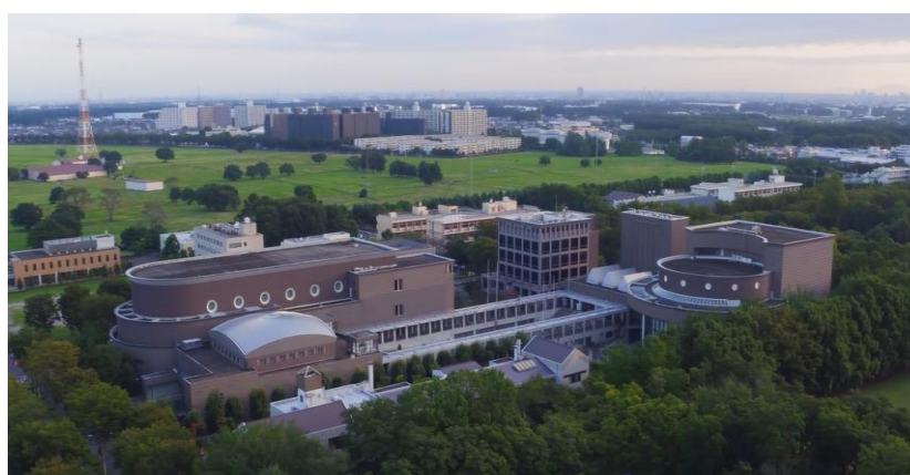
市民文化センター ミューズ