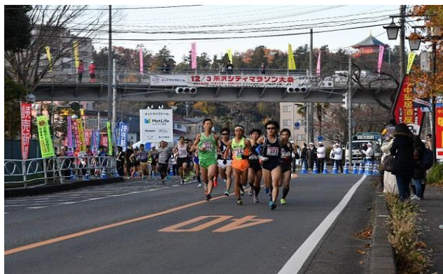
所沢シティマラソン大会