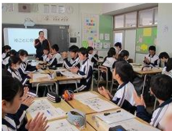
学校での学習の様子