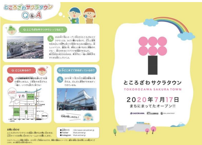
▲▼(株)KADOKAWA 作成の子ども向けパンフレット