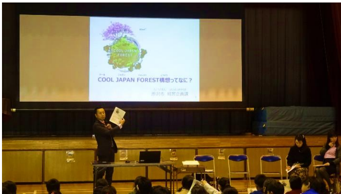
▲当日の出前講座の様子

令和2年1月15日、COOL JAPAN FOREST 構想に関する出前講座を和田小学校で開催しました。