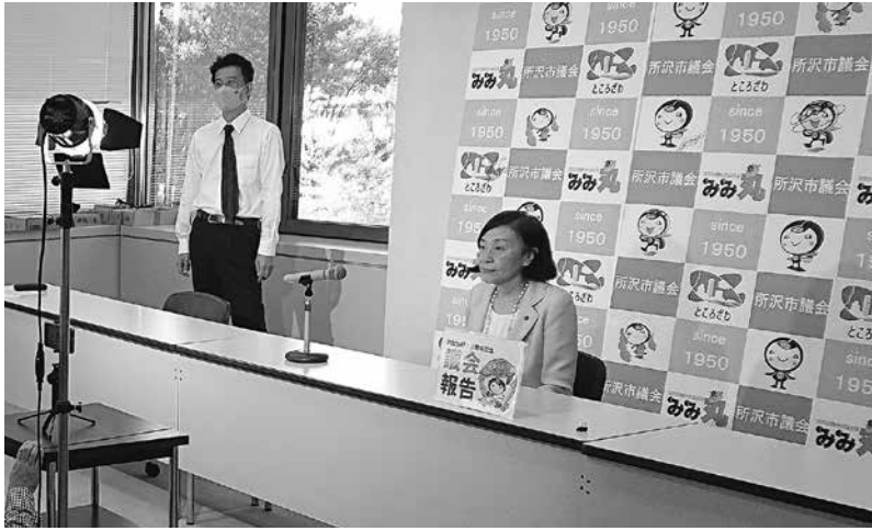
10/29 市議会公式ユーチューブチャンネルで 配信中の議会報告の撮影を行いました