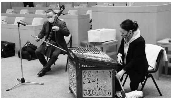
議場コンサートに向けたリハーサル