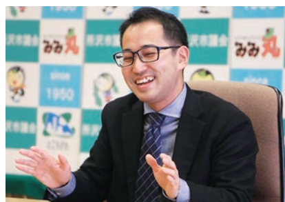
1987年、埼玉県松伏町生まれ。小学3年生から所沢市で暮らし始める。奨励会での厳しいリーグ戦を勝ち抜き、2007年10月にプロ棋士となる。2014年にはNHK杯の本選に出場し6段となる。詰将棋問題の作家としても有名で、雑誌「将棋世界」で執筆を担当している。

— 将棋の強さとは... どれだけ将棋を理解しているかだ... 正確に読むことが出来るかが重要... 対局でも出せる精神力も大切... 一局一局に自分の全力を出し切るように努力しつづける姿勢は、素晴らしいと思います。