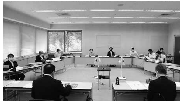
令和元年度所沢市一般会計、特別会計、事業会計 の決算審査を行いました