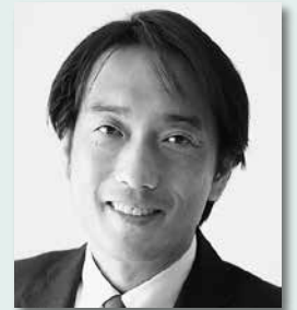
第68代副議長 入沢 豊(3期) (自由民主党・無所属の会)