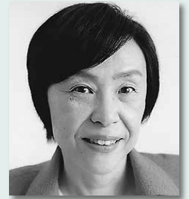
第67代議長 末吉美帆子(4期) (立憲民主党)