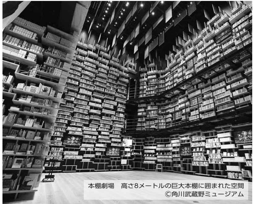
本棚劇場 高さ8メートルの巨大本棚に囲まれた空間