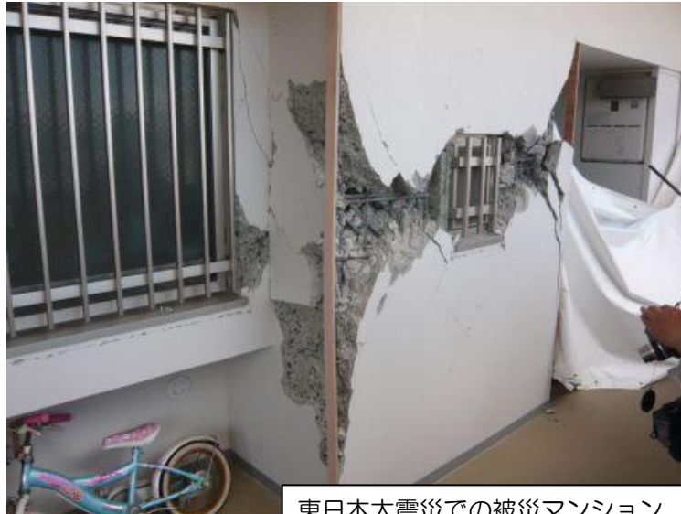
東日本大震災での被災マンション

平成23年9月 同協会会員各社が受託する東北6県と関東1都6県のマンション57,783棟のうち46,365棟(232万7,400戸)を対象としたもの