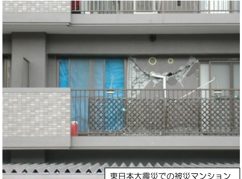
東日本大震災での被災マンション

・平成23年3月11日に発生した東日本大震災のマンションの被災状況は、社団法人高層住宅管理業協会の調査によると次のとおりです。