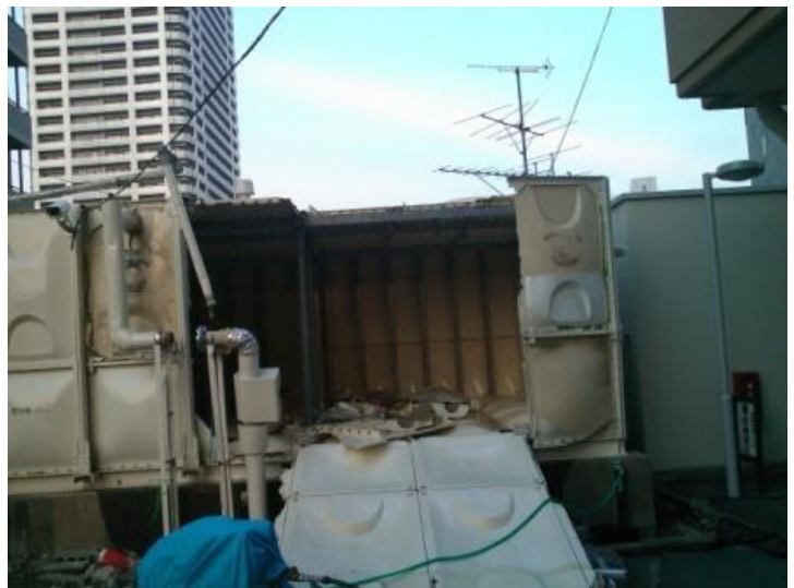
東日本大震災での被災マンション(受水槽)