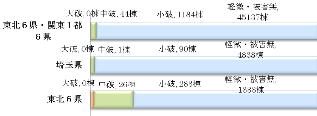
表1 東日本大震災の建物本体の被害

・超高層マンション(20階以上:503棟)では、「大破・中破」は0棟、「小破」39棟、「軽微・被害無」が464棟となっています。