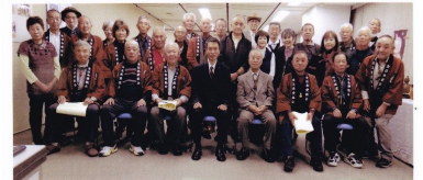
第16回 埼玉県愛瓢会ひょうたん作品展示会 記念 2023・11・10

※「埼玉県愛瓢会」は「特定非営利活動法人 全国愛瓢会」における「埼玉県支部」として活動に参加しております。