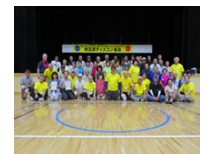
↑所沢ディスコン大会