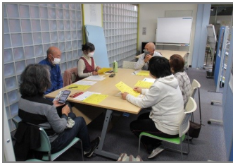
ミーティングコーナー