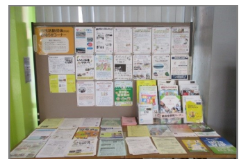
チラシ配架コーナー

登録団体の活動報告や、市との協働による事業の円滑な実施等を目的として、毎月行っています。 また、登録団体同士の交流会も行っており、登録団体であれば自由に参加できます。