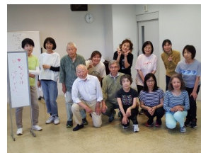
スマイルパイレーツSP