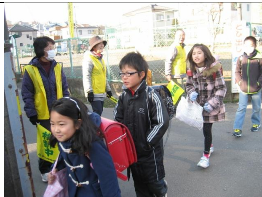
朝の通学時の見守り活動の様子