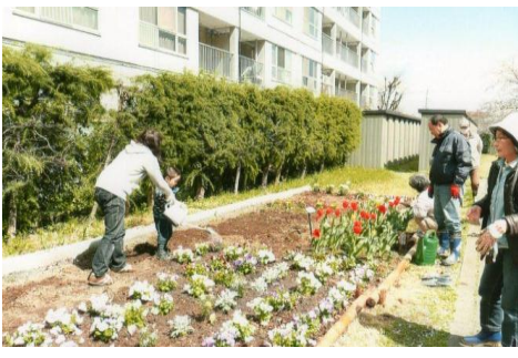
所沢コーポラス管理組合