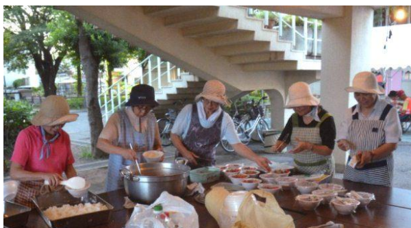
炊き出し訓練の様子（200名分の牛丼を調理）