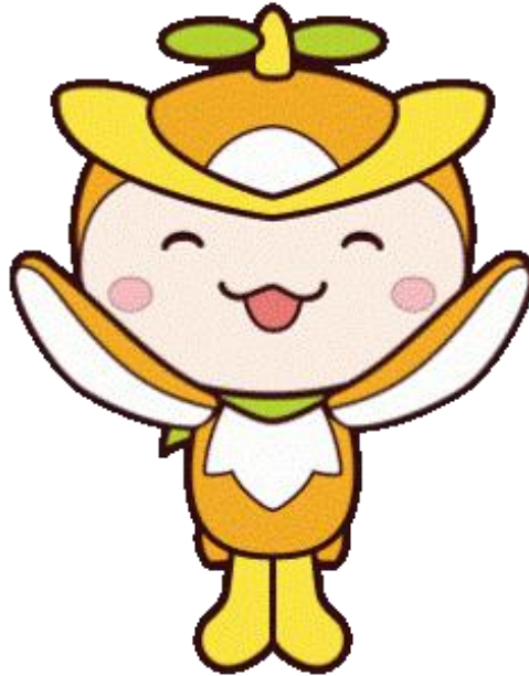
所沢市イメージキャラクター トコロん