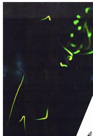
小手指第4区自治会