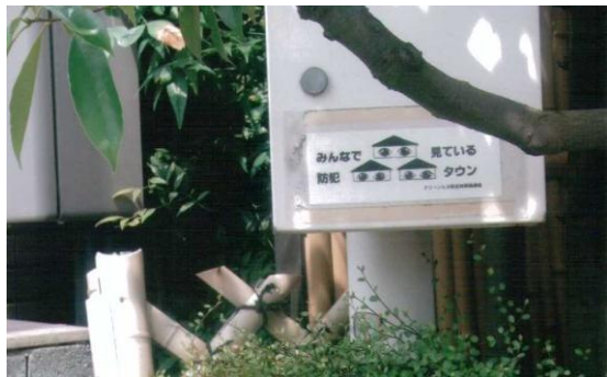
キャッチコピーを門などに取付けて、防犯のアピール