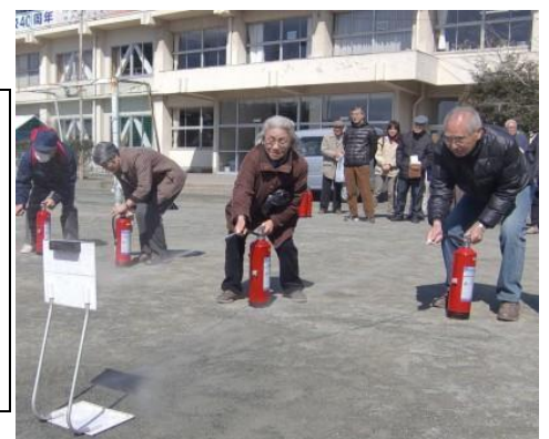
消火訓練の様子 安松小学校

今後、避難所運営の参考にしていく。併せて実施した実践的訓練も参加者から評判がよかった。