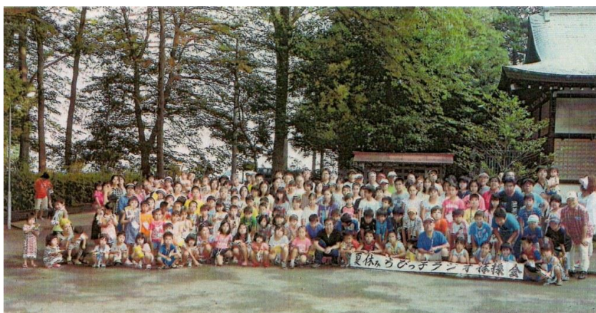
夏休みちびっ子ラジオ体操会 安松神社境内