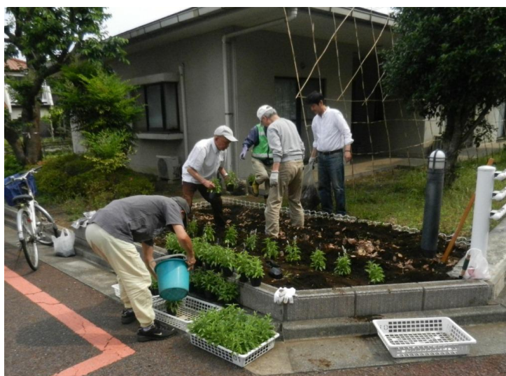
単身高齢者のお宅での花壇づくりの様子

地域力も大切だが、地域のみでの取り組みには限界も感じる意見も多数寄せられた。行政等がタイアップする支援策は今後もますます重要との意見が多数を占めた。