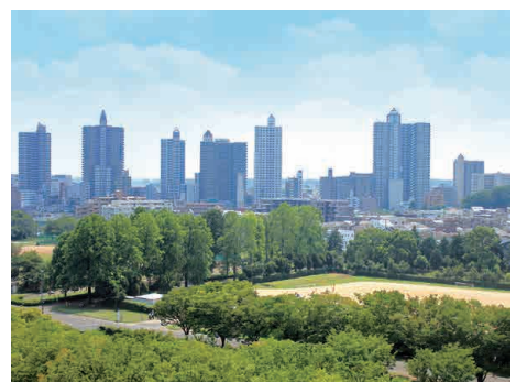
みどり豊かなまち （市役所屋上からの風景）