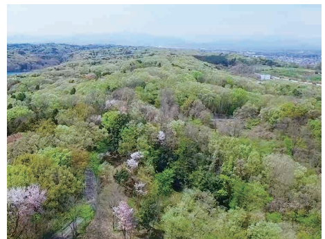
守られた自然（狭山丘陵）