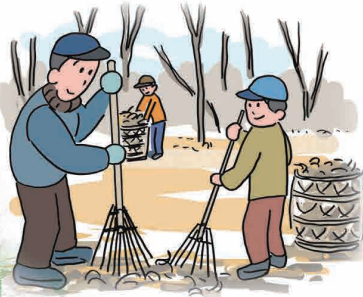
生きものに配慮した農業や武蔵野の 落ち葉堆肥農法が行われています