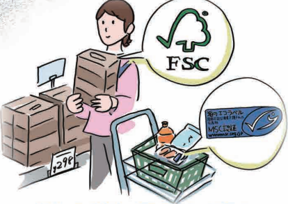
生物多様性に配慮した商品を 購入する人が増えています