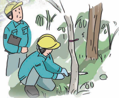
生物多様性を守る取り組みに 多くの企業が参加しています