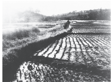
大谷田んぼ（現在の松が丘付近） （1975年（昭和50年）頃）

私たちの暮らしは、生きものにぎわう豊かな自然から、さまざまな「自然の恵み」を受けて成り立っています。生きるために不可欠な水や酸素のほか、食料、繊維、木材などの原料などを得て豊かな衣食住を成り立たせています。子どもたちは自然の中での活動を通じて、体力や思いやりの心など心身の健全な成長を育むといわれています。また、植物の蒸散作用*によって空気を冷やして夏の暑さを緩和したり、雨が地面に浸透・貯留されることによって洪水を抑えるなど、安全、安心で快適な暮らしにも「自然の恵み」は欠かせません。ほかにも、自然は市の地域振興にも深くかかわります。都心から1時間圏内にあ