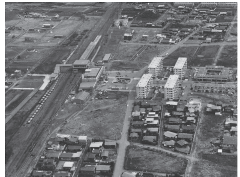
新所沢駅周辺（1960年（昭和35年）頃）