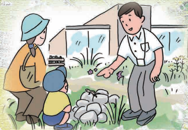
まちなかの様々な場所で、生きものと ふれあえる場所が増えています