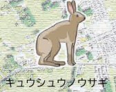
キュウシュウノウサギ