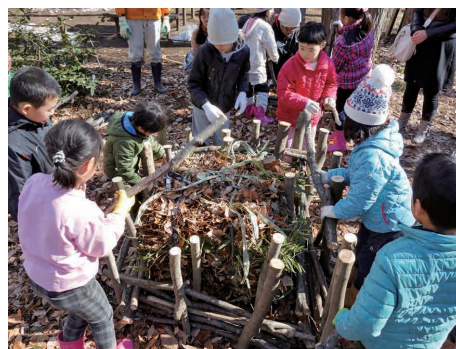
子どもが自然とふれあえるまちに

これら、市の自然状況や、将来にわたって受け続けたい「自然の恵み」、上位関連計画との整合をふまえ、本戦略によって実現するまちの将来像を次の通り設定します。