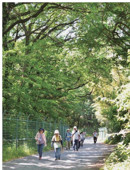
自然を楽しみに多くの人が訪れるまちに