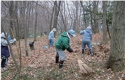
良好な樹林地の保全