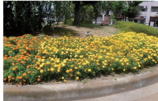
街中の公開利用ができる敷地の緑化推進