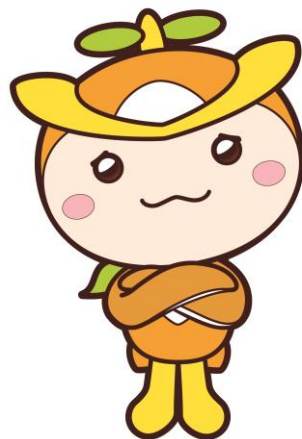
所沢市イメージマスコット トコロん