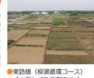
●東路線(柳瀬循環コース)「中富」バス停下車徒歩5分

約300年前の元禄年間(江戸中頃)に、幅40m(約72m)、奥行375m(約682m)の短冊形の地割を1戸分として開拓され、現在も開拓当時の屋敷地、耕地、雑木林の地割が残された歴史的な景観となっています。