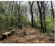
●南路線(吾妻循環コース)「西武園駅」バス停下車徒歩5分

八国山は、なだらかに広がる狭山丘陵の東端に位置し、コナラやクスノキ等の雑木林の中を散策できるよう歩道が整備されています。八国山とは、上野、下野、常陸、安房、相模、駿河、信濃、甲斐の八国山の山々が眺望できたこと由来すると言われています。八国山の中には、源氏の武将である新田重貞の武蔵野征討を偲ぶ軍陣が建立されています。