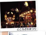
●ところざわまつり

所沢らしい良好な景観は、市民の多くの方によっていただき、親しまれていくことで次世代に継承されていきます。市では、市民の皆さんに景観に対する関心をお持ちいただくために良好な景観を「とことこ景観資源」に指定し、市HP(「とことこ景観資源」で検索)で紹介しています。「とことこ景観資源」のうち、特に所沢らしい良好な景観の形成に資するものを、とことこ景観賞として表彰しています。