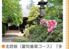
●北路線(富岡循環コース)「多聞院通り西」バス停下車徒歩8分

多聞院は、上層、中層、下層の村民のための祈願所として元禄9年に創建されました。塵沙門堂の建築様式は、和様と唐様を交えたもので、江戸時代中期の御堂建築として貴重なものです。境内には、ボタン、雪割草、クマガイソウなどの植物のほか、ハンカチの木も見られ、日頃の手入れにより、訪れる人を魅了し、和ませる景観となっています。