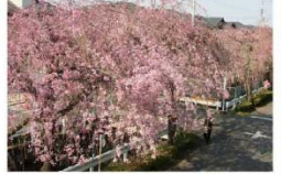
●西路線(新所沢・三ヶ島コース)「小手指公園北」バス停下車徒歩5分

昭和50年代の土地区画整理事業に伴い、砂川堀の両岸約500mにわたり119本の紅白のしだれ桜が植樹されています。しだれ桜は、静かに流れる水路に沿って連なり、周囲の閑静な街並みの形成にも活かされており、街のシンボリックな景観となっています。