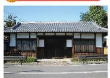
●東路線(松井循環コース)・南路線(山口循環コース)「東新井」バス停、又は東路線(松井循環コース)「あけぼの橋北」バス停下車徒歩5分

所沢郷土美術館は、幕末から明治時代にかけての医家として、主屋、長屋門、土蔵が国の登録有形文化財として2005年に登録され、現存する医家住宅として貴重な景観となっています。