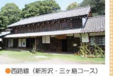
●西路線(新所沢・三ヶ島コース)「大日堂」バス停下車徒歩5分

旧和田家住宅(クロスケの家)は、製茶業を営んでいた農家の屋敷で、主屋・製茶工場・土蔵共に築100年以上の歴史のある建造物です。昔の農家の生活文化にふれることができ、周囲の茶畑・屋敷林は、ふるさと所沢の面影を残しながら自然を感じることが出来る景観となっています。