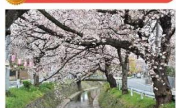
●東路線(松井循環コース)・南路線(山口循環コース)「東新井」バス停、又は東路線(松井循環コース)「あけぼの橋北」バス停下車徒歩5分

市内中央部を流れる東川の沿岸には、東京オリンピックを記念し、西新井町から牛沼に至る全長約2kmの両岸に180本が植樹されています。現在では、東所沢まで約5kmの桜並木となっています。開花時期には夜桜を楽しむ場所もあり、多くの方から親しまれ、持たれている景観となっています。