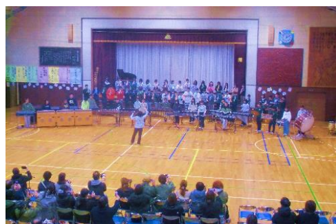
音楽発表会の様子

児童は運動会、音楽発表会、学校まつりを通して、「うまくできることができた。」「来年は6年生のようなことをしてみたい。」と達成感を得られることができた。また、保護者からは「行事が戻ってきた感じがありがたい。」とあった。今後も児童が夢を持つことができるような教育活動を進めていきたい。