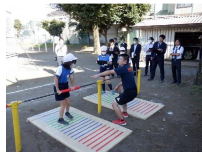
西部地区小学校研究会発表会

「上小まつり」、「図書サポーター」との連携を行い、保護者、地域の方々との連携を高めることができた。次年度も連携を深め、地域とのつながりを大切にしていく。