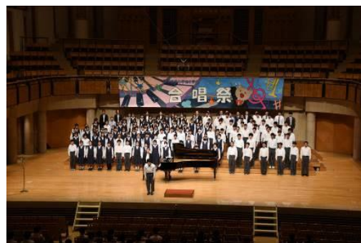
合唱祭（ミュージズ大ホール）

本校は「主体的にたくましく生きる生徒」を学校教育目標とし、その達成のために、生徒一人一人が活躍できる場や行事を設定し、個性の伸長を図るとともに奉仕の精神や地域の一員としての意識の育成に力を入れている。3大行事（体育祭、合唱祭、三送会）を中心に学校行事を生かして知徳体のバランスのとれた生徒を育成し、粘り強く最後まで頑張る「小手中魂」の伝統を継承し地域と共にきれいな学校・元気な学校づくりを目指している。