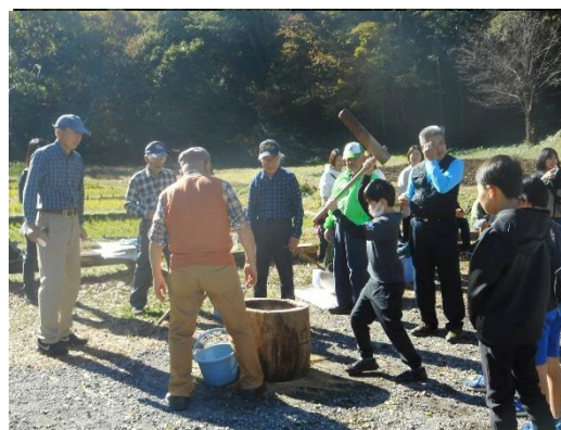
糎谷八幡湿地での餅つき

本校は明治6年に宝玉院を仮校舎として開校した歴史のある学校で、周囲には名産の茶畑が広がるなど、豊かな自然に恵まれた地域である。親や祖父母が本校の卒業生という家庭も多く、本校の教育活動にも大変協力的である。「みんなやさしく かがやいて じょうぶな体 まじめな子」という学校教育目標のもと、家庭や地域とのつながりの深さを生かしながら、信頼される学校づくりを進めている。