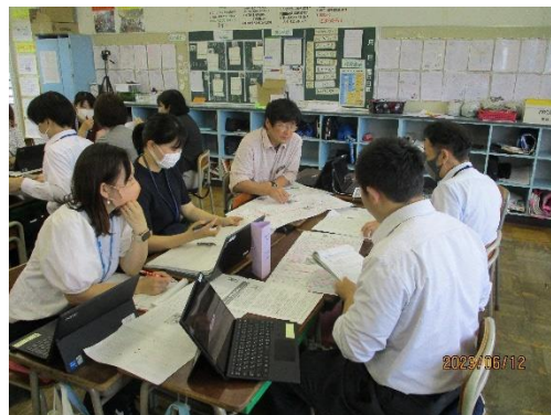
授業後の研究協議

本校は「思いやりのある子」「たくましい子」「すすんで学ぶ子」を学校教育目標に掲げ、「全教職員の持ち味と創意を活かして組織力・学校力を高め、子どもと保護者・地域の願いに応える特色ある教育の推進する」という学校経営方針のもと教育活動に取り組んでいる。そして、「子どもも大人もさわやかに登校し、元気に活動し、笑顔で下校する学校」を目指す学校像として、以下具体的に取り組んできた。