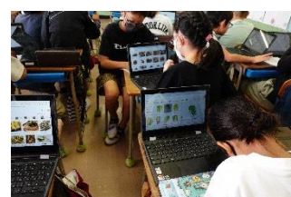
ICTを利用した 総合的な学習の時間

校内研修では、【「わかった」「できた」を実感できる授業づくり～学級経営を核とした授業改善～】を目指して研究に取り組んだ。学校指導訪問を実践の場とし、5/29（月）に全員が授業実践を行った。