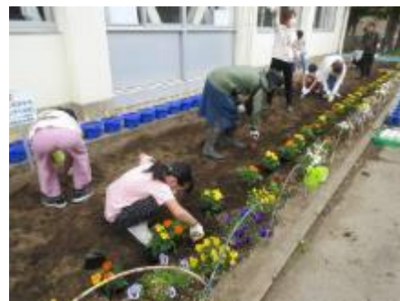
「花いっぱいプロジェクト」