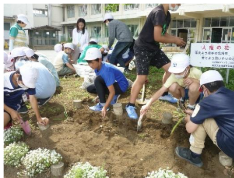
植栽活動（園芸委員会）