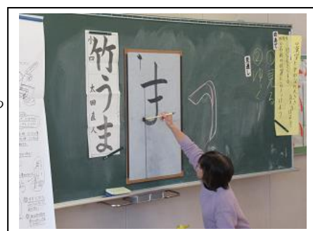
書きぞめ講師による授業風景