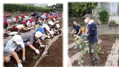
後援会の農家さんに毎年お世話になっているサツマイモの収穫体験