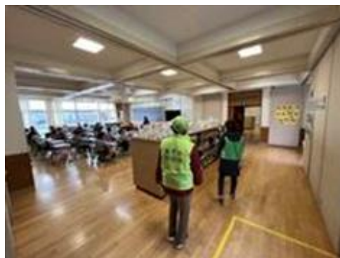
【松井小ふらっとサポーター】