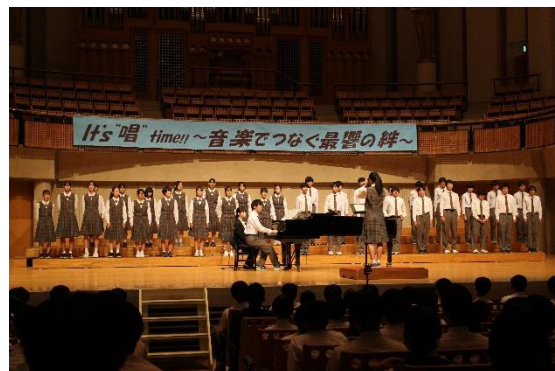
合唱祭 所沢市民文化センター ミューズ

学校教育目標「自立・共生・貢献」、教育理念「はじめに子どもありき」のもと、「能動的な学習者としての子ども観」に立った授業を日々実践している。その中でも、所中三本柱「挨拶・合唱・ボランティア活動」を大切に、生徒のよさや可能性を伸ばしている。また、協力的な地域の方々の支えもあり、多くの教育活動を実施でき、協働体制を築けている。今後も、特色ある学校づくりを通して、誇りに思う（家族・地域に誇れる）学校を目指していく。また、学校・家庭・地域が一体となり、各小学校との連携も図りながら、子どもの主体的な学びを実現している。