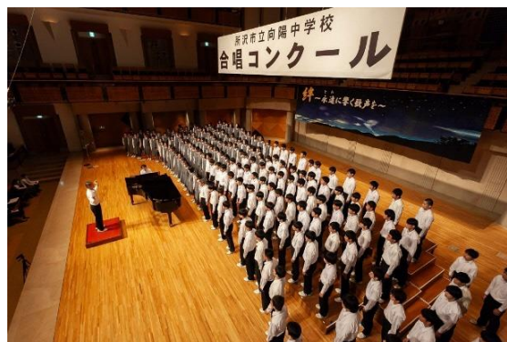
令和6年度合唱コンクール@ミューズ