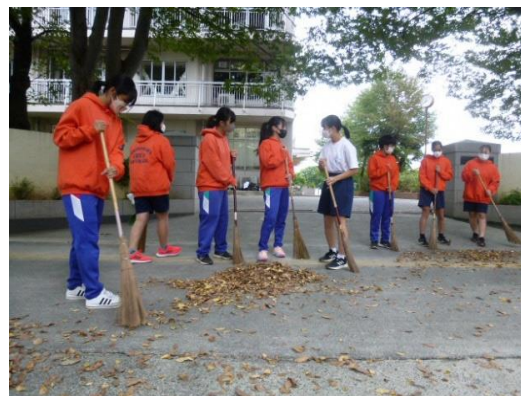
毎朝行っている落ち葉掃き・挨拶活動