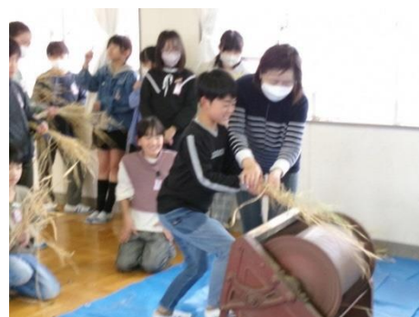
米作り脱穀(5年総合的な活動の時間)