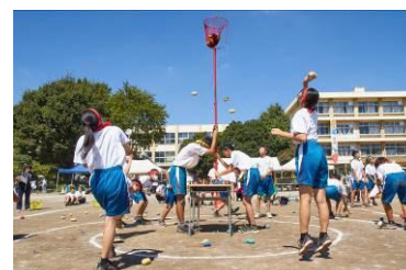
競技を精選した体育祭

生徒が学校行事に意欲的に取り組む過程を通して、生徒の豊かな心を養い、思考力、判断力、表現力を高める活動を行った。本校の体験活動は、1年「校外学習」、2年「林間学校」3年「修学旅行」を柱とし、行事は「体育祭」、「合唱祭」、「三年生を送る会」を三大大行事として行っている。今年度も感染症対策のため行事の参観に制限があったため、体育祭や合唱祭の動画が閲覧できるサイトを作成し、生徒が活躍する姿を家庭により広く見ていただけるよう工夫した。生徒が行事や体験活動を通じて自信や成就感を身に着けることを目指している。