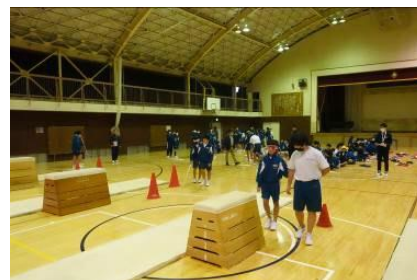
2年生福祉学習「白杖体験」

の3つを基本に指導を進めてきた。一人一人のよさを見つけ伸ばし、力をつけ、身につけた「学び」を内に向け外に向け発信し、つないでいく。生徒たちに学習活動を通して気づかせ、学ぶ過程を大切に、体験活動や外部指導者を招いてのキャリア教育や福祉体験の充実を図った。生徒の現状・保護者・地域の願いを受け学校課題を把握し、目指す学校像の実現のため、教職員の生徒指導・教育相談に対する意識向上も図った。