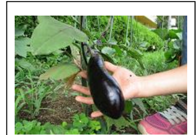
育てた作物の収穫