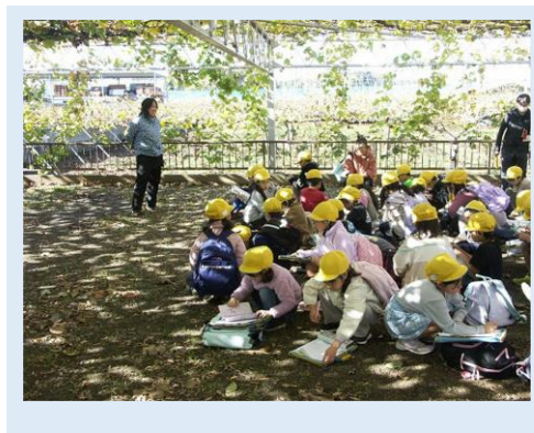
再開したぶどう園での体験学習

本校は、所沢市の東端に位置し広い農村地帯と区画整理された住宅街を学区内に持つ。保護者や地域住民には本校の卒業生も多く、学校の教育活動に苦勞を惜しまず、協力をしてくださる地域性がある。今年度も校長の経営方針のもと「地域に根ざし、やさしさと笑顔、意欲にあふれる学校」の実現を目指し地域学習をおし地域と共に歩み、地域に愛される教育活動を実践した。