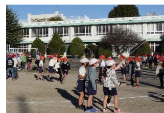
全校朝会：「長縄跳び」

運動する喜びが味わえる体育科授業実践は、昨年度から継続し、子供たちの体力向上に努めている。年間を通して、朝マラソン、運動チャレンジを実施し、季節限定での取組として、業間マラソン、長縄跳びを実施している。体育の授業では、毎時間の振り返り活動を位置づけて行い、自分の運動量の確保に努めた。