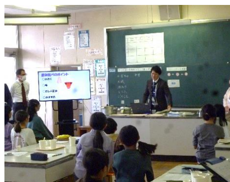
埼玉県小・中学校

本年度、本校グランドデザインの中で「豊かな心と健やかな体の育成-レジリエンスを高める-しなやかに たくましくへこたれない心-」を掲げ、最重要課題としている。本事業においては、それと関連し「環境教育及び学校環境の整備-環境は人をつくる されど環境は人がつくる-」に向け、ボランティアさんに毎月お願いしている玄関の花飾りの原材料費や小中連携を意識し、合同音楽朝会として同時中継をするためにSIMカードの購入した。また、草刈用の刃など教育環境整備に事業費の多くを当ててきた。併せてレジリエンスの育成に向け外部ボランティアや校内研修にも事業費の多くを当てた。