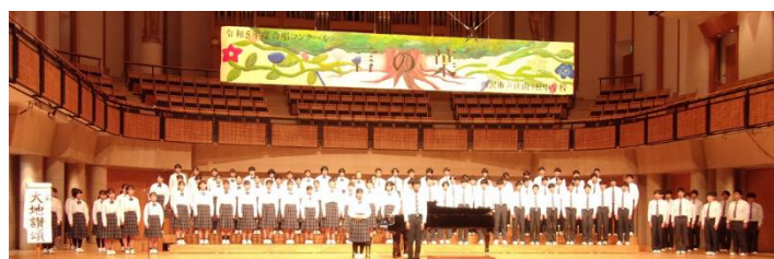
(令和5年度合唱コンクール)