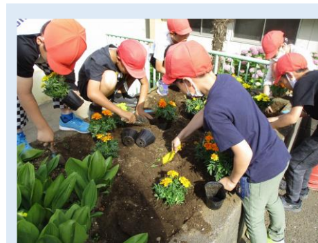
環境整備：環境委員会の活動から 花苗を花壇に植えている様子

「子供を大切にする学校～地域・家庭・学校が一体となって創る『笑顔と挨拶、美しい歌声が響く学校』～」を目指す学校像とし、本市教育の基本理念「3つの宝を大きく育てる」を具現化し、子供たち、保護者・地域、教職員が誇れる魅力ある学校づくりを推進してきた。「ふるさと所沢を愛する心」については、「出会いと対話」を合言葉に、地域の教育資源を活用し、地域からも学ぶ子供たちを育成した。「未来を拓く知恵」については、ICTの活用による授業改善を促進するとともに、特別活動（話し合い活動）の学校研究により、児童の思考力・判断力・表現力を育成してきた。「心身のたくましさ」については、体力向上の取組、基本的な生活習慣づくり、体験活動の場等の環境を整備しつつ、あきらめない心や運動好きな児童を育成してきた。