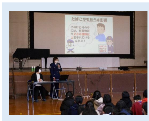
薬物乱用防止教室（6年）

本校は全教職員の経営参画のもと学校教育目標「自ら学び心豊かでたくましい子の育成 考える子 思いやりのある子 元気な子」の具現化を目指し、特色ある学校づくりの指針である「生き生きと学び高め合う美しい学校づくり」を推進している。そのためには、教育活動の中心である授業の充実を図っていくことが重要であると考え。本校では、学習指導要領が目指す知・徳・体のバランスのとれた「生きる力」を育むために、常に授業の改善を図り、「わかる喜び」「できた喜び」を味わわせることのできる質の高い授業実践に取り組んでいる。