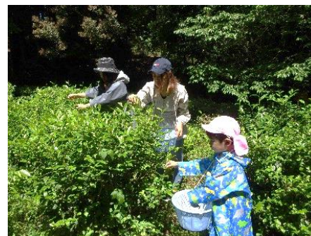
親子でお茶摘み体験

※荒幡地区の自然に恵まれた教育環境や地域の人材を幼稚園教育に生かし、家庭との連携を図りながら「みんなの笑顔が集まる所沢第二幼稚園」を目指す。