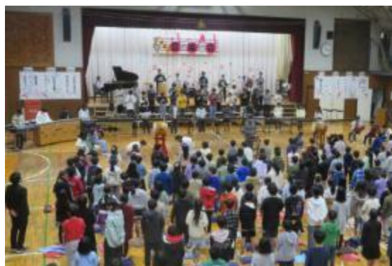
6年生による「三富おろし」の演奏で1～5年生が合唱をする。校内音楽会のクライマックス。

給食に食材のご提供をいただいている農家のお力添えをいただき、さつまいもの苗植えから収穫までを体験する活動をしている。自分達が収穫したさつまいもが給食に使われ、心に残る活動になっている。