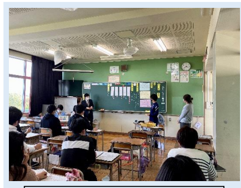
年度当初校内研修