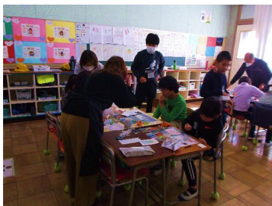
特別支援学級の図工の授業

そして、徐々に各教科で必要な物品の申し出が、分掌主任から伝わるようになった。運動会や縦割り班活動で必要なものを購入し、人と人との関わりを味わい「よい人」になるための支援をしてきた。