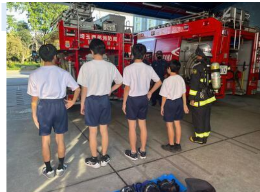
消防署での2年生職場体験

本校は、「進んで学び、心身を鍛え、協力して働き、生きる力を伸ばす生徒」という学校教育目標の具現化のため、保護者や地域の方々の協力により、行事や体験活動を行い特色ある教育活動を展開している。本年度は感染症対策が解除され、地域の教育力をより生かし、地場産業のお茶を学ぶ茶道教室や職場体験等の数多くの体験的な学習を実施した。