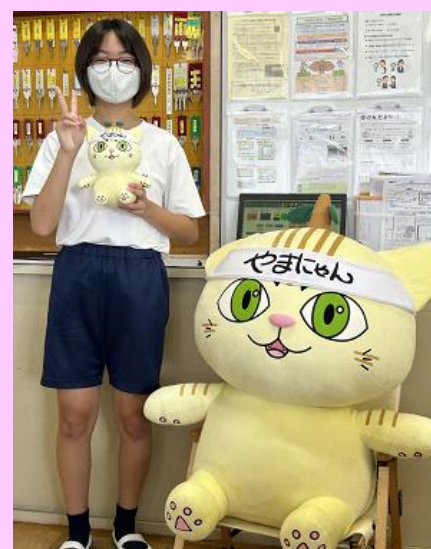
原作者（生徒）と やまにゃん