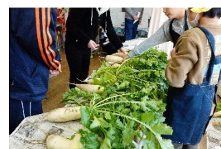
かがやき学級 野菜の販売学習

本校の中庭には、農園が広がっており、栽培活動が盛んである。2～6年生・特別支援学級（かがやき学級）が農園を活用し、白菜、大根、にんじん、小松菜、サツマイモ等を育てている。今年も野菜が育ち、特別支援学級では、販売学習を行うことができ、勤労する意欲や豊かな心の育成につながった。大根や里芋は、学校給食の食材として利用し、栄養士による給食校内放送で、紹介していただいた。