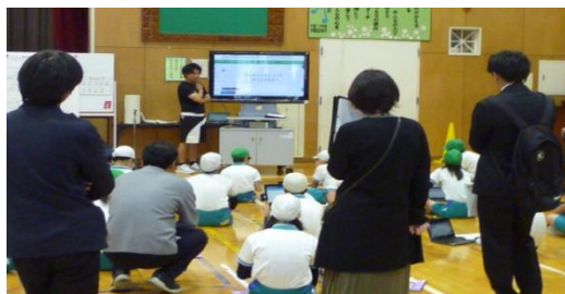
【体育】ICTを効果的に活用した授業の実践 授業研究発表