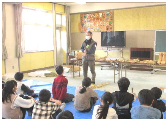
5年生わら細工づくり体験