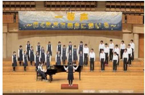
合唱コンクール クラス合唱

地域の方々の方々の厚意により、多くの教育活動が支えられ、協働体制も築けている。特色ある学校づくりを通して、「自信と誇りを持ち、未来にはばたく東中生徒を目指し、地域と共に育つ学校づくり」を推進した。