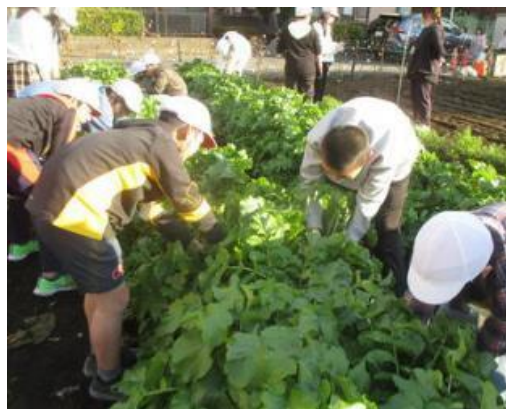
学校農園で大根を収穫する子供たち

昨年に引き続き、学校経営の基本理念を「真の学び舎は子供が主役」とし、学校・家庭・地域が子供たちのよき理解者・支援者となることを目標に、特色ある学校づくりを進めてきた。また、子供たちの確かな学力の向上のために体験活動や開かれた学校づくりに積極的に取り組んできた。また、昨今の気候変動による熱中症対策を中心とした安全安心な学校づくりに努めてきた。