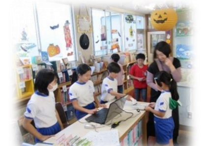
図書ボランティアさんにもお手伝いいただき、図書管理の電子化を進めています