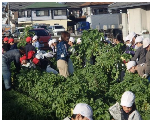
だいこんの収穫(3年生)

また、地域に根ざした体験活動や多くの人々とのふれあいを通して、児童に感動を与える教育課程づくりを重視し、心豊かでたくましい児童の育成を目指している。