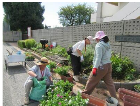
ボランティアによるお花植え

所沢市〈学び創造アクティブ PLUS〉を推進し、「はじめに子どもありき」の視点に立った児童の育成を目指し、Chromebookを活用した活動の工夫に取り組んだ。昨年度に引き続き東京学芸大学名誉教授の平野朝久先生のご指導に加え、今年度より昭和女子大学特命教授の岩間健一先生にもご指導いただき、教職員の指導力向上を図ることで、児童の学力向上につなげていった。