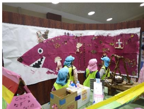
『森のミュージアム』で自分達の作品を見ている子ども達