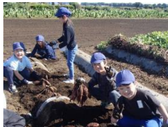
2年生のさつまいもの収穫の様子。1年生、特別支援学級の児童とともに、苗植えや芋掘りの体験学習を行っている。