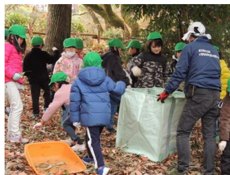
いきものふれあいの里センターで 落ち葉集めをする児童

本校は豊かな自然環境に恵まれ、学校に隣接する荒幡富士では郷土史を学ぶことができ、いきものふれあいの里センターでは自然体験や生き物観察も行うこともできる。地域住民の方々や保護者は、地域への愛着や学校への思いが強く、学校に大変好意的で、環境整備や教育活動にも積極的に協力して下さる。これら地域の教育資源や地域人材を活用し、学習を進めてきた。他者を意識し進んで関わるための「あいさつ」の取組に力を入れたり、人との関わりの中でコミュニケーション能力を高めるために、体験的な学習や3人組での学び合う活動を多く取り入れたり、他者や集団から尊重される経験を積むために、集会活動やグループエンカウンターを意図的に実施したりしてきた。そして、子供が嬉々として登校し、充実した活動をし、満足して下校する学校を創り上げている。