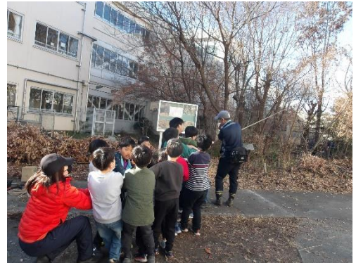
ビオトープ管理維持活動 木の伐採の様子