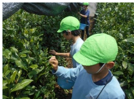
茶畑での茶摘み体験

学校の敷地内にある「むくろじ農園」では、ボランティアの「むくろじ農園協力隊」の方々の支援を受けて、児童が多くの作物を栽培、収穫している。これらを一部給食で使用し、収穫の喜びを全校で共有した。また、「総合的な学習の時間」に地域特産のお茶について学習し、近隣の茶畑で茶摘み体験をさせていただくなど、実際の体験をして学習を深めることができ、自ら積極的に調べる児童の姿が見られた。