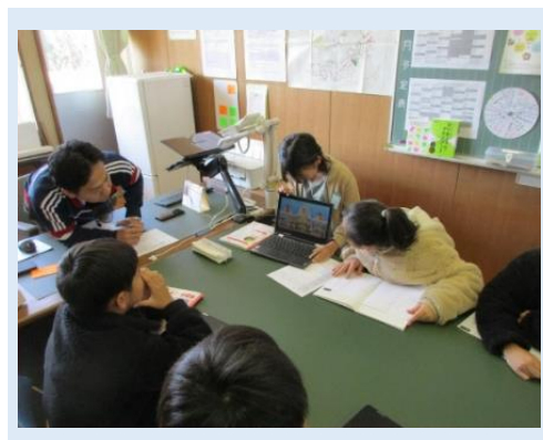
【プレゼン資料を用いた討論会】

あわせて、学校ホームページの移行を機に、児童の活動を保護者や地域に向けて発信した。学校・家庭・地域・学校応援団等、人と人のかかわりを深める活動も進めていき、信頼される学校づくりを目指し、「おはよう」から「さようなら」まで安心して学べる元気な学校づくりを推進する。