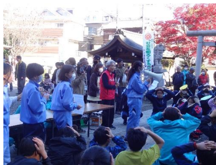
焼き芋大会ゲームの様子

焼き芋の準備はもちろん、生徒が主体となって進めた地域の幼児やその保護者等とのゲームの進行については、地域の方々とのふれあいの機会となり、学校と地域の絆を深める温かい活動となった。生徒が主体的に考え、活動し、体験したことは、子供たちにとって何よりの学びの場につながったと感じている。