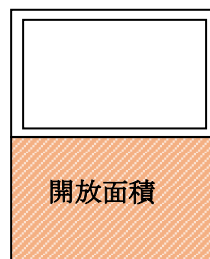
【例②】上下スライド窓