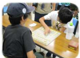
将棋教室(7/23~毎火曜全5回) 協力・新所沢東将棋同好会