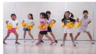
チアダンス教室(8/1) 協力・所沢北高校チアダンス部