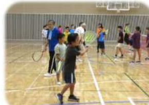
ミニテニス(8/20、21) 協力:ミニテニス優飛