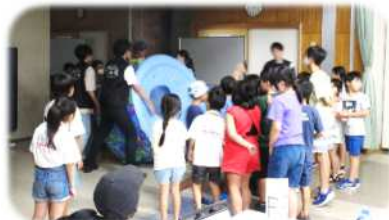
科学教室 (8/9) 空気砲の様子 協力・東大 CAST