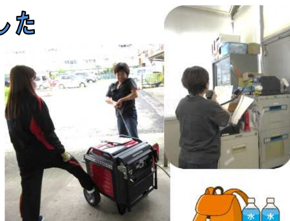
▲無線チェックや発電機の稼働などを行いました

災害は季節や時間を問わずいつやってくるかわかりません。油断せず防災グッズの点検や備蓄食料の消費期限等のチェックも忘れずに実施しましょう!