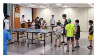
卓球教室(8/6) 協力・所沢北高校卓球部