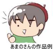
あまのさんの作品例

持ち物：筆記用具、色鉛筆 申込み：10月5日(木)から 公民館 受付時間：午前8時30分～ 午後5時15分(月曜・祝日不可)